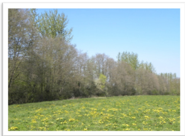
Une aulnaie-frênaie formant une ripisylve bordant un ruisseau : elle s'interpose entre le cours d'eau et une terre labourable occupée par une prairie temporaire. Les racines de cette haie contribuent à épurer les eaux de ruissellement qui gagnent le ruisseau.