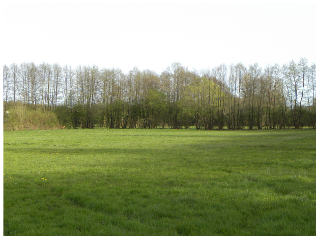
Haie d'aulnes, implantée au sein de prairies fraîches tapissant une zone alluviale. Cette haie participe à l'assainissement de ces prairies humides. « Barrant » la vallée, elle tend à atténuer l'effet des crues.

Sera considérée « haie hydraulique », notamment, toute haie dont le rôle primordial est de participer à la régulation de la situation hydrique d'un site , à savoir :