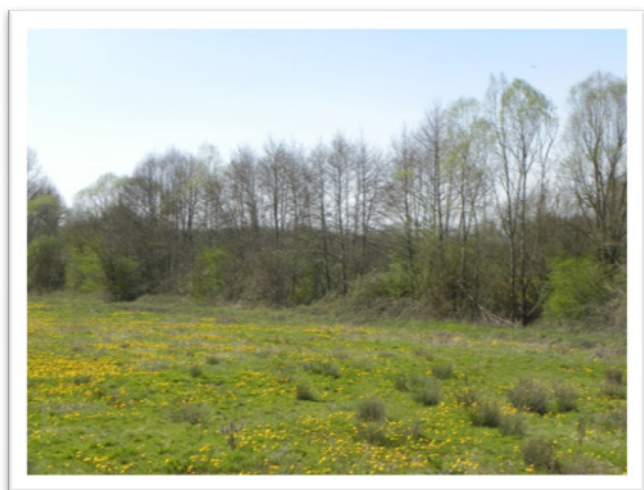
Double haie, brise - vent moyen, à base d'aulnes glutineux. Cette haie contribue à stabiliser les berges d'un cours d'eau assez profond - dénommé « Le Ru Profond » - et à « pomper » l'humidité de la prairie, humidité soulignée par la présence de joncs.

Les haies contribuent largement à épurer les eaux qui gagnent les nappes phréatiques ; leurs racines consomment une part importante des polluants, en particulier d'origine agricole (engrais, produits phytosanitaires...).